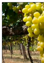
«WEEKEND IN CAMPAGNA»