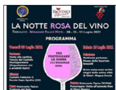
A TREBISACCE LA NOTTE ROSA DEL VINO