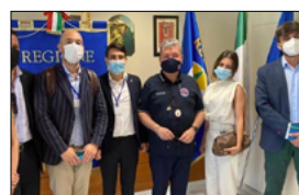
REGIONE E COMITATO SPINONE A SUPPORTO DEI GIOVANI