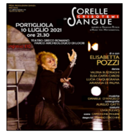
A PORTIGLIOLA LO SPETTACOLO 'SORELLE DI SANGUE'

MOSSIDE XXXVI EDIZIONE DEL PREMIO MONDIALE DI POESIA: ULTIMI GIORNI PER PARTECIPARE