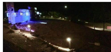
IL BANDO GRANDI EVENTI METTE A RISCHIO IL ROCCELLA JAZZ FESTIVAL