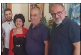
ARBERESHE, A FRASCINETO IL SINDACO DI VALLONA