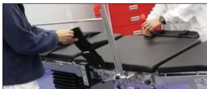
NEL 2020 IN CALABRIA -30% PER PRESTAZIONI AMBULATORIALI E SPECIALISTICHE