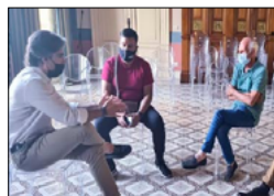
METROCITY: AUTORITÀ SANITARIA SBLOCCHI VERTENZA