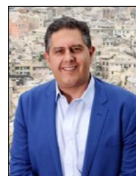
DA OGGI TOTI (CAMBIAMO) È IN CALABRIA