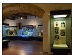
A VIBO LA MOSTRA 'UNO SCATTO PER VOLARE'