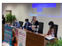
PRESENTATO IL PROGETTO 'CASAPAESE' DICICALA