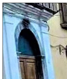
DUE MILIONI AI PALAZZI GENTILIZI DI CASSANO