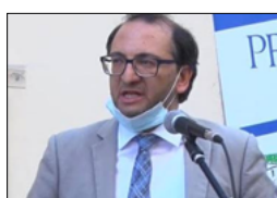
URGE TUTELARE PATRIMONIO DELLE TERME LUIGIANE