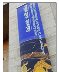
LA MOSTRA "SALVATI DALL'OBLIO"