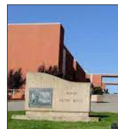
PARTE IL CORSO DI MEDICINA E TECNOLOGIE DIGITALI