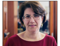
Abate (Misto): Costruzione banchina crocieristica al Porto di Corigliano è realtà

PREMIA L'INFORMAZIONE DI QUALITÀ: FAI UNA DONAZIONE A CALABRIA.LIVE CON UN CLICK QUI