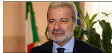
CON GESTIONE LONGO NESSUN CAMBIO DI PASSO NELLA SANITÀ