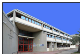
IL PROGETTO DI ORIENTAMENTO PER L'UNIVERSITÀ