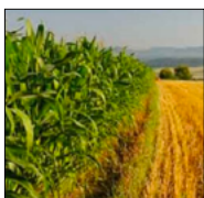
1 MILIONE PER INVESTIMENTI NON PRODUTTIVI