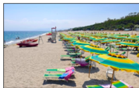
ICOMUNI NON ESTENDONO CONCESSIONI DEMANIALI AL 2033