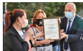
NEL 'CIELO SEMPRE PIÙ BLU' DI CROTONE SI È CELEBRATO RINO GAETANO