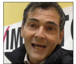
Sapia (Alt.c'è) interrogazione al Governo per atto aziendale Mater Domini Catanzaro

PREMIA L'INFORMAZIONE DI QUALITÀ: FAI UNA DONAZIONE A CALABRIA.LIVE CON UN CLICK QUI