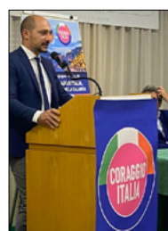
PRESENTATO IL PARTITO "CORAGGIO ITALIA"