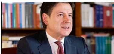
GIUSEPPE CONTE: UN PATTO TRA TUTTE LE FORZE PROGRESSISTE