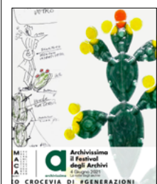
ARCHIVISSIMA, IL FESTIVAL DEGLI ARCHIVI