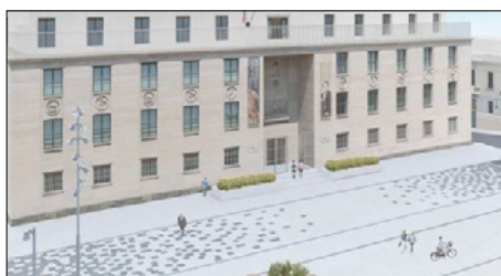
GLI AMICI DEL MUSEO SUL RESTYLING DI PIAZZA DE NAVA: RENDERE PARTECIPATI I CITTADINI