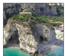
IL FASCINO IMMENSO DELLA CALABRIA