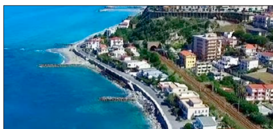
SAN LUCIDO DIVENTA UN POLO D'ATTRAZIONE DEI PROGETTI PER L'EFFICIENZA ENERGETICA