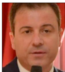
«SPIRLÌ RIDICOLIZZA LA CALABRIA»