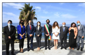
AL COMUNE LA MAGGIORANZA CONTESTA LA GIUNTA REGIONALE