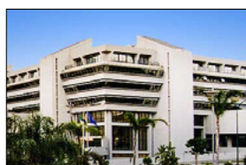
ADESIONE AL MANIFESTO DELLA "COMUNICAZIONE NON OSTILE"