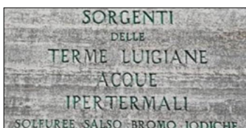
SACCOMANNO (LEGA): UNA CHIUSURA INGIUSTIFICABILE E NON TOLLERABILE