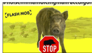
AGRICOLTORI E CITTADINI SCENDONO IN PIAZZA CONTRO I CINGHIALI