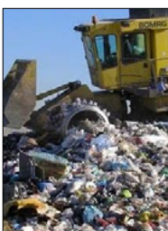
LA DISCARICA LA SILVA SARÀ CHIUSA