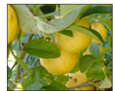
DALLA REGIONE 2,8 MILIONI PER LA FILIERA