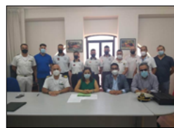
È ATTIVA LA CAPITANERIA DI PORTO A LE CASTELLA