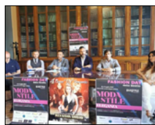
AL VIA IL FASHION DAY DELLO STRETTO