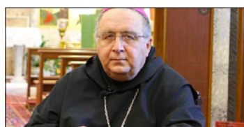
MONS. MOROSINI: APRIRE LE TERME PER NON TRADIRE IL BENE COMUNE