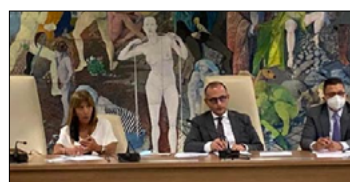
DE CAPRIO: SERVE TRACCIARE STRADA PER PRESERVARE IMPRENDITORIA SANA