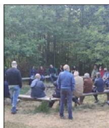
ASSEMBLEA DI CALABRIA RESISTENTE E SOLIDALE