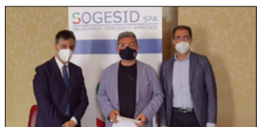
INTESATRAREGIONE E SOGESID PER ACCELERARE TEMPI DI INTERVENTI