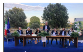
PRESENTATA PROPOSTA PER IL DISTRETTO TURISTICO LOCRIDE