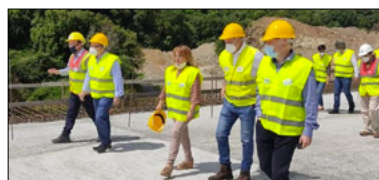
I LAVORI DELLA GALlico-GAMBARIE SARANNO FINITI ENTRO GIUGNO 2022