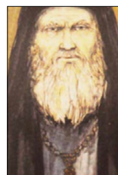
SEMINARA RICORDA BAARLAM