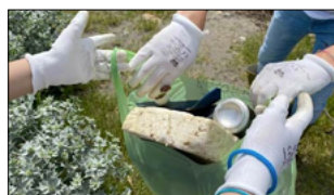
SUCCESSO PER L'INIZIATIVA DELLA FAI CISL IN CALABRIA