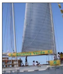
IL FLASH MOB DI GOLETTA VERDE DI LEGAMBIENTE