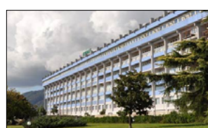
CURARSI IN CALABRIA È POSSIBILE. UNA BELLA TESTIMONIANZA