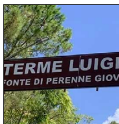
ACQUAPPESA E GUARDIA P. MOROSE NEI PAGAMENTI