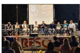
APALMI PRESENTATO PROGETTO "RESQ-PEOPLE SAVING PEOPLE"