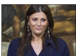
POSTE EMETTE UN FRANCOBOLLO PER JOLE SANTELLI