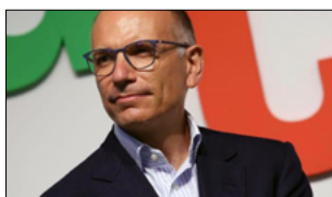
DOMANI IN CALABRIA IL SEGRETARIO DEL PD ENRICO LETTA