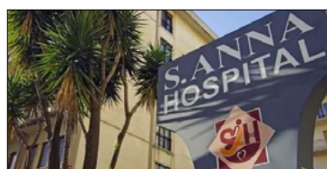
SAPIA (ALT.C'E): SERVE TAVOLO ISTITUZIONALE PER SALVARE IL SANT'ANNA HOSPITAL