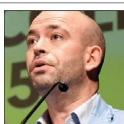
SAPIA (CISL): PREVISTE RISORSE PER 255 MILIONI

MANDATORICCIO (CS) ALL'IC Comprensivo la Biblioteca Umana Una bella iniziativa