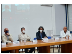
PRESENTATO PROGETTO DEL NUOVO POLO ONCOLOGICO