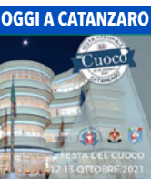
OGGI A CATANZARO