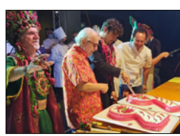
SI È CHIUSO IL 29° PERONCINO FESTIVAL