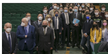
ALL'UNICAL AL VIA CORSO DI LAUREA IN MEDICINA E TECNOLOGIE DIGITALI

LA MINISTRA MESSA: « INNOVATIVO E VINCENTE »