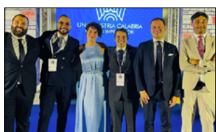
DARE ATTENZIONE A COMPETENZE E PUNTARE SULLA FORMAZIONE