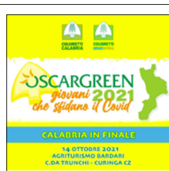
LA FINALE DEL PREMIO OSCAR GREEN CALABRIA