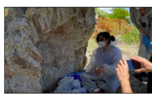
PARTITI LAVORI DI RESTAURO AFFRESCO DELLA CHIESA DELL'ANNUNZIATA