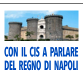
CON IL CIS A PARLARE DEL REGNO DI NAPOLI