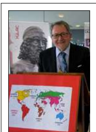
SI PRESENTA IL PREMIO NOSSIDE 2021

ALTMONTE (CS) Successo primo incontro Festival Euromediterraneo Prossimo evento domenica 5