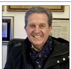
SACAL DEVE ESSERE PUBBLICA E RAPPRESENTARE I CALABRESI