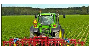
COLDIRETTI CALABRIA: SERVONO INTERVENTI URGENTI PER AGRICOLTURA