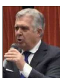
FORTI, COLTI E CALABRESI UMANI