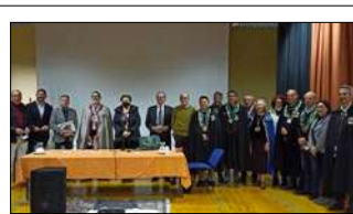
CONFRONTO CON LA CONFRATERNITA DELLA FRITTOLA CALABRESE