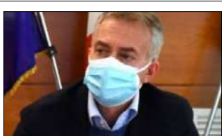
COMMISSIONE EUROPEA APPROVA MODIFICA AL PSR CALABRIA