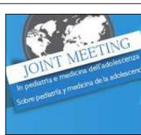
DOMANI S'INAUGURA L'11° JOINT MEETING