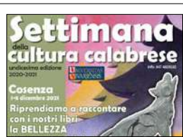
AL VIA LA SETTIMANA DELLA CULTURA CALABRESE