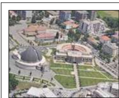
I COMUNI SERRE COSENTINE A CONFRONTO SU PNRR