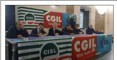
CGIL, CISL E UIL: GOVERNO CAMBI LA BOZZA LEGGE DI BILANCIO