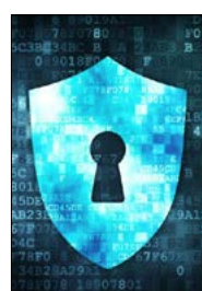
IL WEBINAR SULLA CYBERSECURITY

CATANZARO Si presenta il programma di Trame 11 Domani alle 12