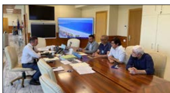
OCCHIUTO INCONTRA I SINDACI DI ACQUAPESA E GUARDIA PIEMONTESE