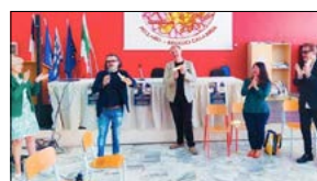
GRANDE PARTECIPAZIONE PER LO STAGE SULLE TRADIZIONI POPOLARI