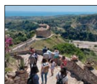
NEL BORGO L'EVENTO DI IGRS CALABRIA