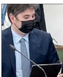
ATTIVARE NEUROPSICHIATRIA INFANTILE NEL VIBONESE