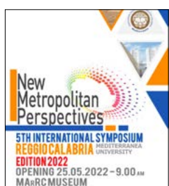
AL VIA IL SIMPOSIO NEW METROPOLITAN PERSPECTIVES