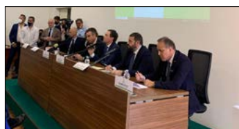
LA PRIMA COMUNITÀ ENERGETICA SARÀ REALIZZATA IN CITTADELLA