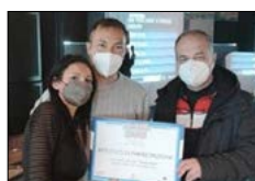
GRANDE SUCCESSO PER IL COSENZA WINE DISTRICT