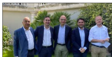
ENRICO LETTA A LAMEZIA: C'È ATTENZIONE PER LA CALABRIA