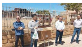
CONCLUSO PROGETTO "IO NON RIFIUTO, FACCIO LA DIFFERENZA"