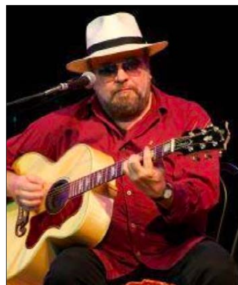
Roberto Ciotti (1953-2013)

Previsto, inoltre, il riconoscimento Roberto Ciotti, uno tra i più grandi chitarristi blues italiani, scomparso prematuramente nel 2013. ●