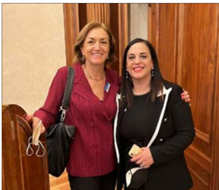
Il primo rapporto sul Turismo delle Radici è stato presentato in Senato

A chiudere l'incontro molto partecipato Giovanni Maria De Vita, Consigliere d'ambasciata e coordinatore per il Turismo delle Radici presso il Ministero degli Affari Esteri e della Cooperazione Internazionale, il quale ha parlato di progetti futuri per la valorizzazione dei borghi nell'ottica del turismo di ritorno. ●