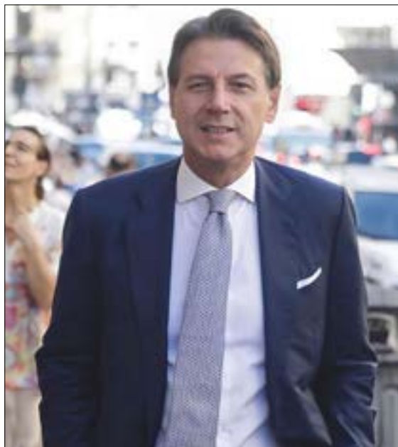
Giuseppe Conte in queste elezioni è stato premiato dal Sud: «Sentiamo tutto il peso della fiducia che ci avete dato, non la tradiremo mai»

«Con Giorgia Meloni siamo entrati nei libri di storia», ha dichiarato Fausto Orsomarso, nel corso dello speciale Elezioni de L'Altro Corriere Tv.