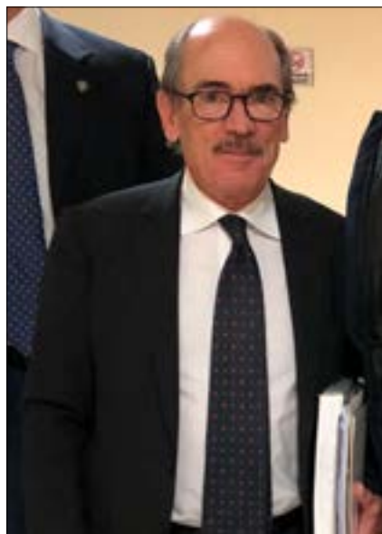
Federico Cafiero de Raho

«Un gran giorno di festa per Fratelli d'Italia - ha detto ancora - il cui impegno costante sui territori che ha permesso di raccogliere i frutti di un lavoro di prossimità e presenza, è stato riconosciuto da elettori attenti a scegliere il merito e la competenza. Valori per i quali Fratelli d'Italia, ha ricevuto un mandato ampio per governare l'Italia e aggredire da subito le tante emergenze dalle quali è incalzata».