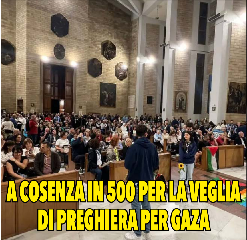
A COSENZA IN 500 PER LA VEGLIA DI PREGHIERA PER GAZA