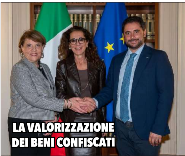
LA VALORIZZAZIONE DEI BENI CONFISCATI