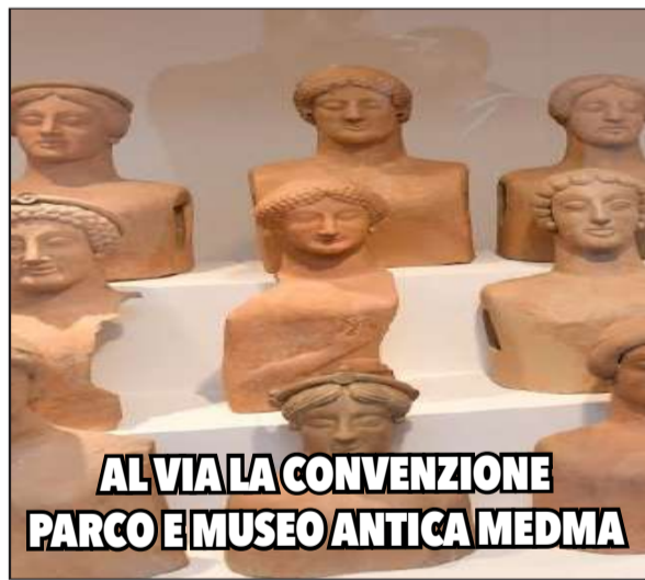
AL VIA LA CONVENZIONE PARCO E MUSEO ANTICA MEDMA