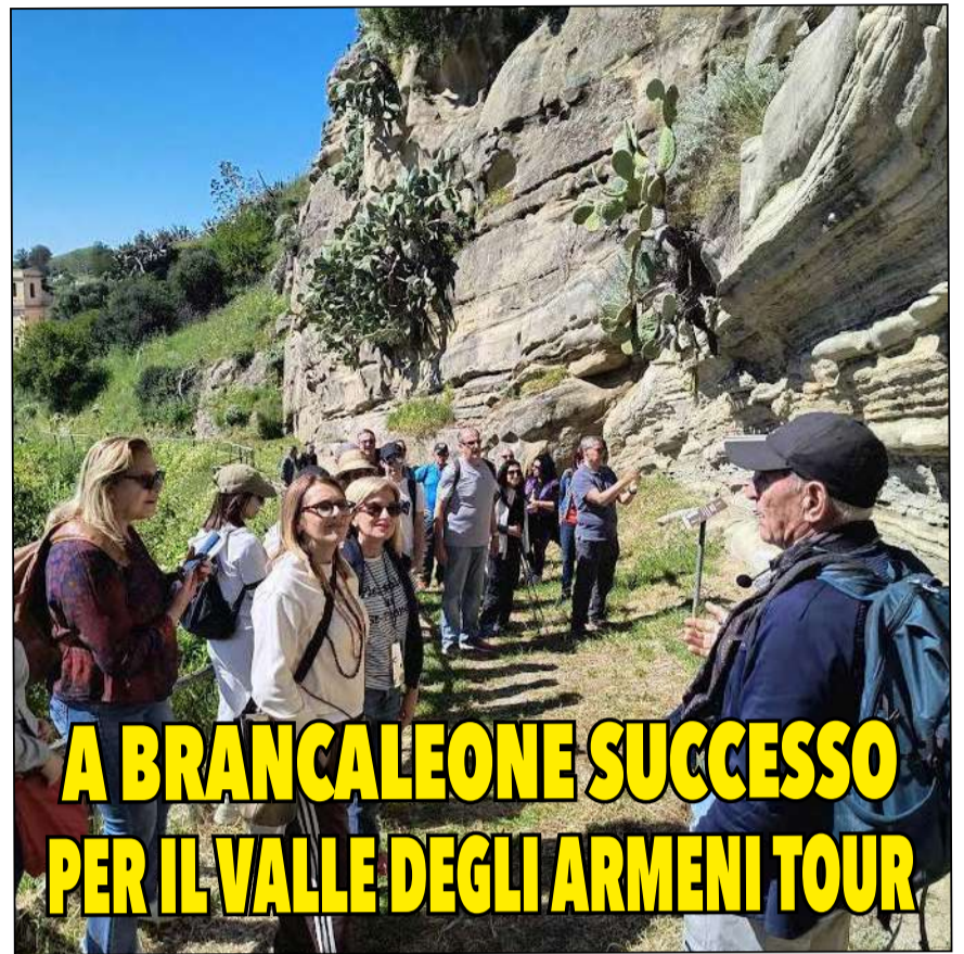
A BRANCALEONE SUCCESSO PER IL VALLE DEGLI ARMENI TOUR